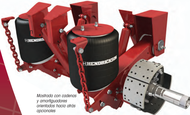
Mostrada con cadenas y amortiguadores orientados hacia atrás opcionales

Tome ventaja de todos los beneficios probados de la tecnología de suspensión-eje-frenos integrados para sus aplicaciones severas — especifique el modelo INTRAAX® servicio severo. Hendrickson, el líder mundial en suspensiones de aire para remolques, ofrece el primer sistema integrado de 30,000 lbs. de capacidad estructural para las aplicaciones de servicio y arrastre severo.