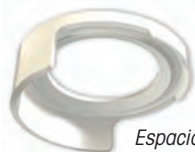
Espaciador del tubo del buje tipo envolvente