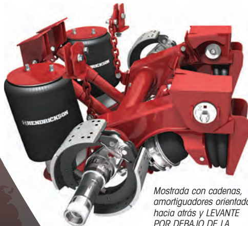
Mostrada con cadenas, amortiguadores orientados hacia atrás y LEVANTE POR DEBAJO DE LA VIGA™ (UBL™) opcionales

Los sistemas INTRAAX de servicio severo cubren sus demandas en operaciones fuera de carretera y otros lugares severos donde la máxima fuerza y durabilidad requeridas. Alturas de manejo desde 14 hasta 17 pulgadas en el modelo Montaje Superior (AAEDT 30K) y desde 9 hasta 19 pulgadas en el Perfil Bajo/Levantable (AAEDL 30K).